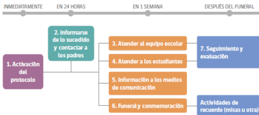
Figura 6. Pasos a seguir tras suicidio consumado al interior del establecimiento 2

En favor de adaptar los procedimientos, se debe realizar de forma oportuna seguimiento y evaluación de las actividades realizadas señaladas en el protocolo.